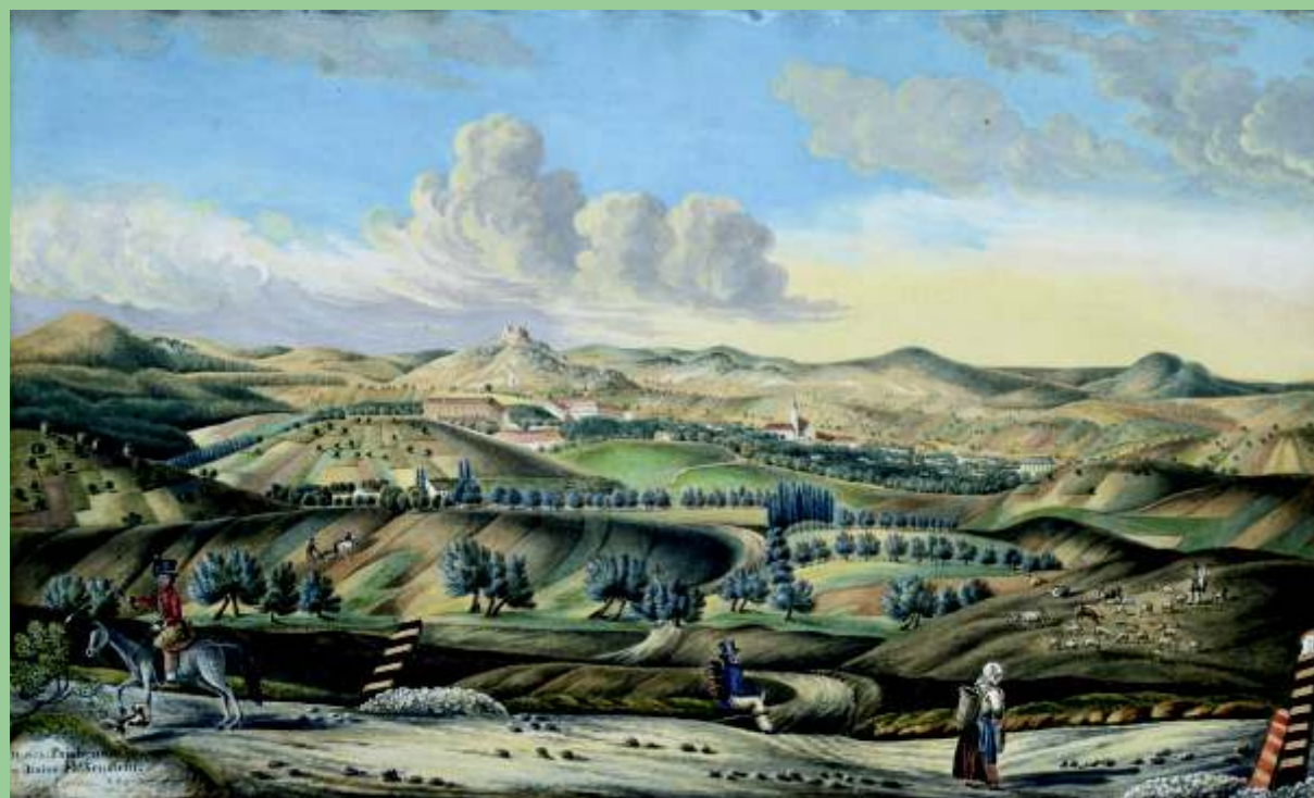
Die Brünner Straße zwischen Poysdorf und Drasenhofen in einer gemalten Ansicht von 1844. In der Bildmitte sind Poysbrunn und die Burg Falkenstein zu erkennen. Die schwarz-gelben Pfosten am Wegesrand weisen die Straße als Reichsstraße aus. Auf ihr sind ein rotbefrackter Postreiter und eine Bäuerin unterwegs.